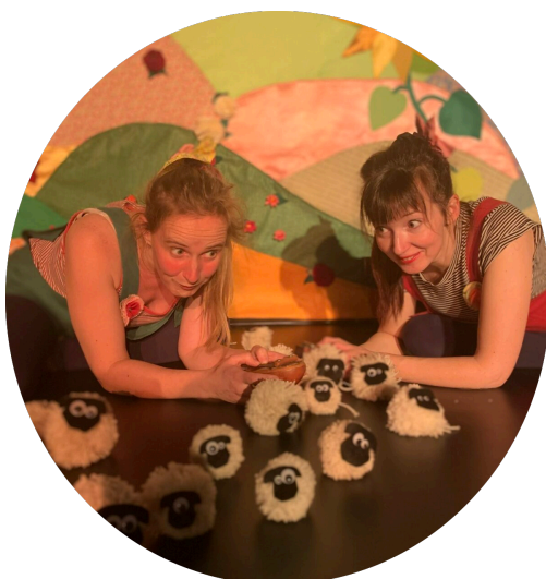
Sous le Ciel Compagnie Le Banc Blanc- 2019