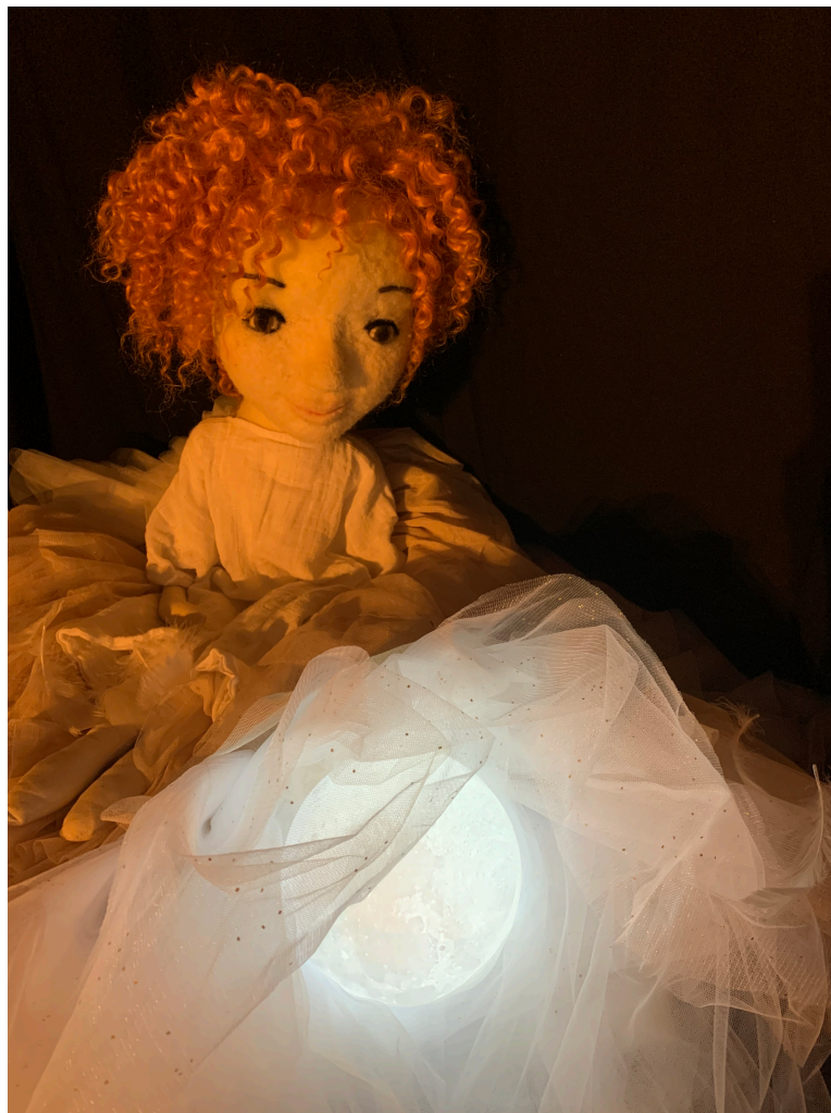
La marionnette de Baba Moon

Spectacle de marionnettes, danse, chant et musique pour le très jeune enfant de la naissance à 6 ans