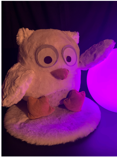
Le hibou doudou du spectacle Baba Moon

Pour nous raconter cette histoire, les interprètes joueront de leurs voix, d'instruments aux sonorités diverses et aux rythmes changeants.