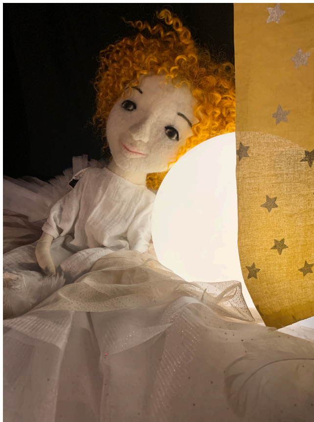
La marionnette de Baba Moon