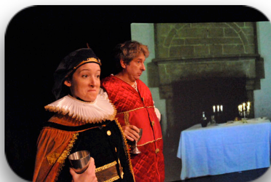
Twelfth Night Compagnie Le Banc Blanc -2013